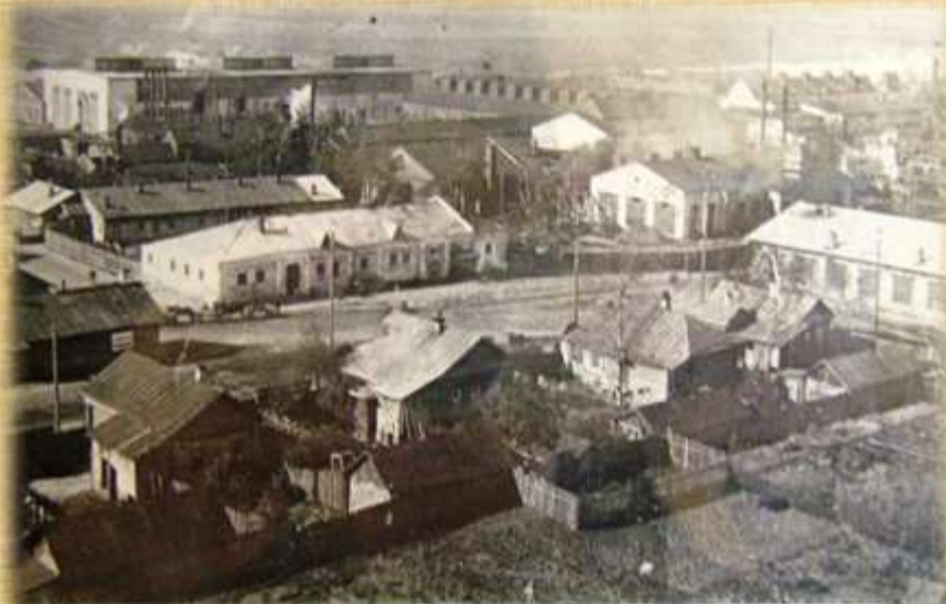
Жилые дома поселка «Рабочее приволье» 1920-е гг.