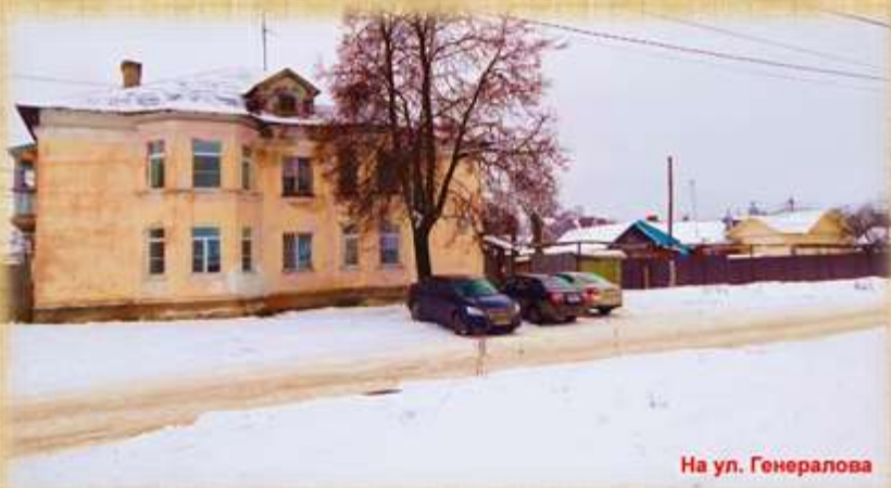
На ул. Генералова

Названа в честь Героя Великой Отечественной Войны, капитана гвардии Генералова Алексея Петровича (1918-1944). В начале XX века на северной окраине города Коврова, возникает новый жилой массив, названный Пекином, так как первыми застройщиками оказались рабочие, вернувшиеся с военной службы из Китая, которым в виде вознаграждения отводились бесплатные земельные участки под постройку изб. В феврале 1964 года ковровские улицы получили имена ковровчан – Героев Советского Союза: ул. 2-я Полевая (до этого часть пос. Пекин) – имя Алексея Петровича Генералова.