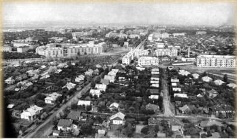
Южная часть деревни Улица Ватутина. 1970 год.

Улица Ватутина (бывшая деревня Салтаниха 1760-е гг.) названа в честь Ватутина Николая Федоровича (1901-1944гг.). Современная улица Ватутина – это часть древней магистрали Шуя-Ковров-Судогда. «В деревне была одна широкая, подобная зеленому ковру, улица, вдоль которой стояли дома в два порядка. На конце деревни, с восточной стороны, прежде находился большой пруд, в котором купалась ребятня».