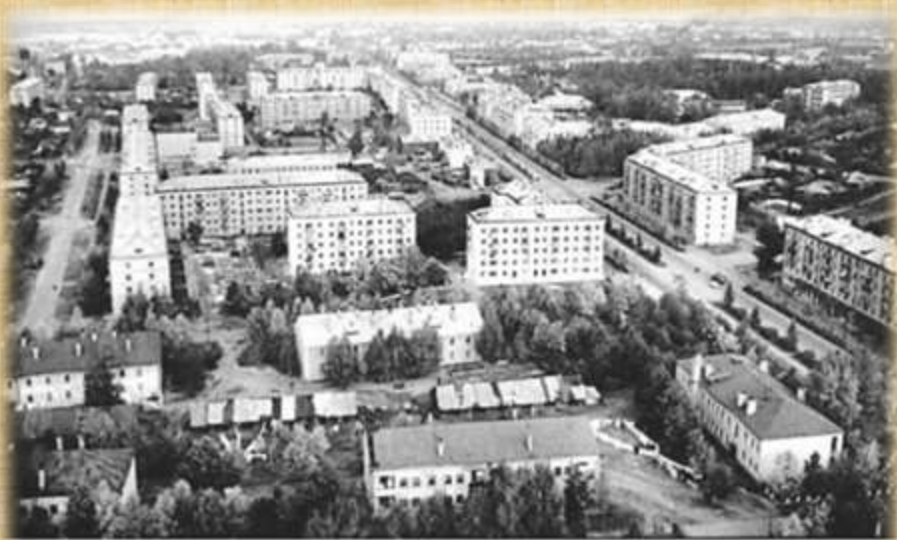
Вид на улицу Лопатина и проспект Ленина, 1970 г.